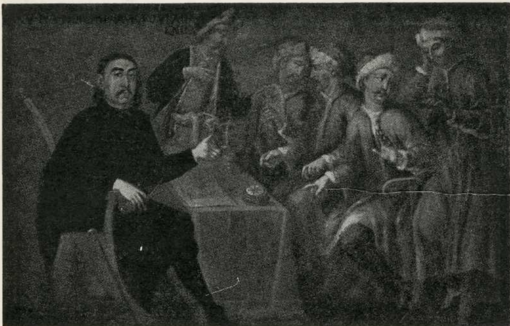
Škola kapetana Marka Martinovića (1698. god.)

tipa »šambek« iz kraja 18. stoljeća kao i model jedrenjaka »Splendido« i portret kapetana Iva Visina, prvog Jugoslavena koji je oplovio svijet, od 1852. do 1859. godine.