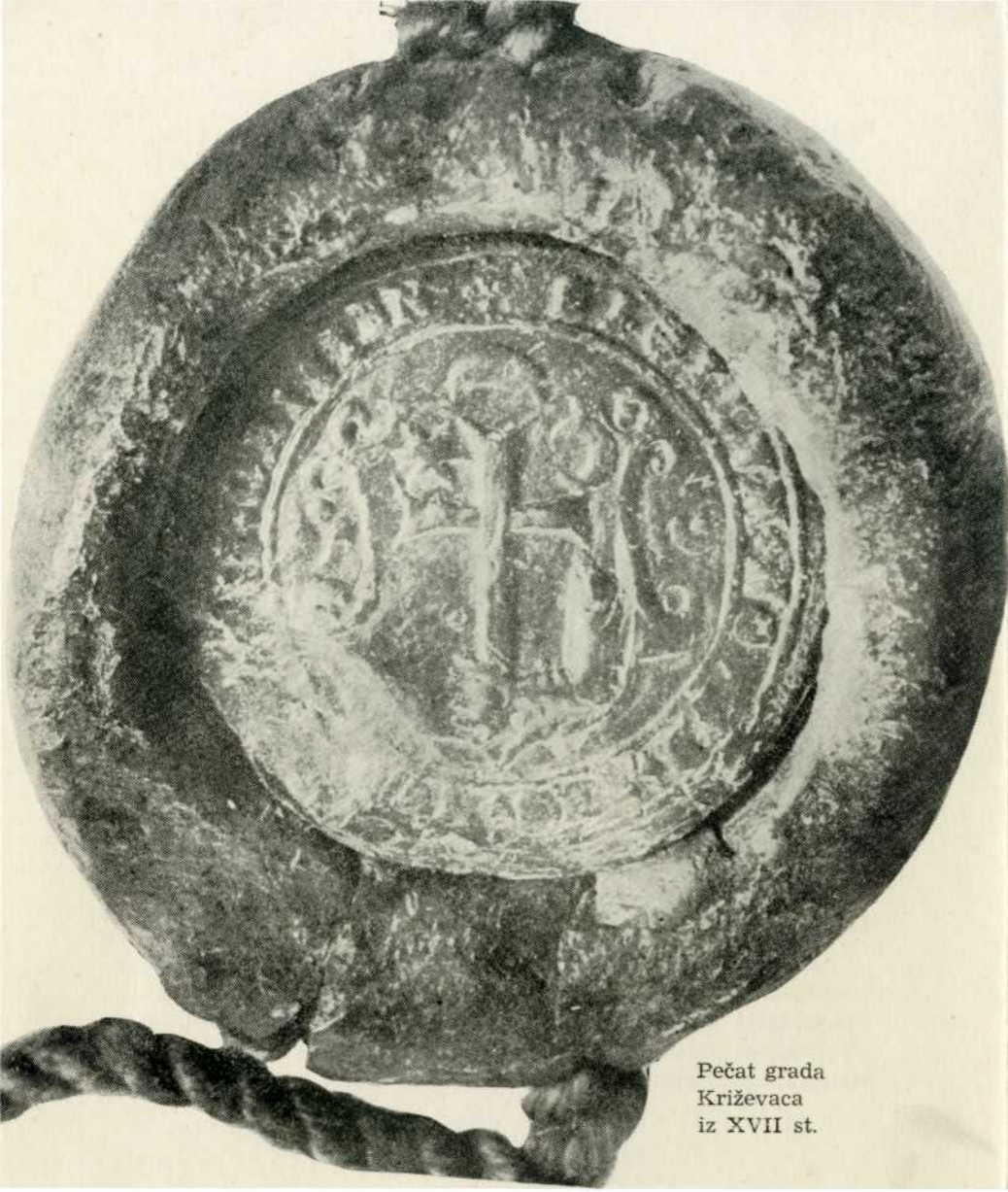
Pečat grada Križevaca iz XVII st.