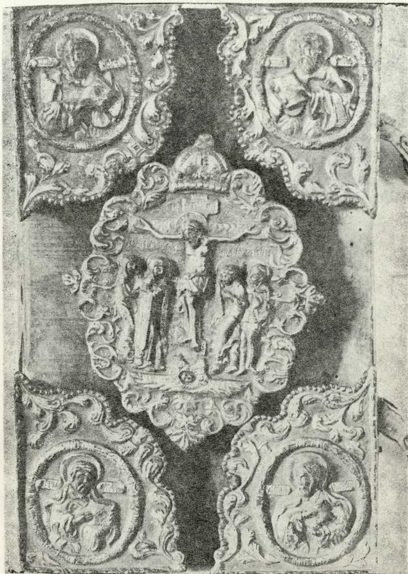
Okov evanđelja, 1735. g.